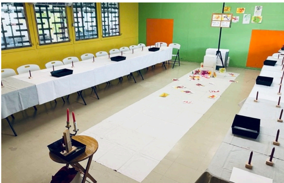
Sortie de résidence à la Scène Conventiionnée Art Enfance Jeunesse et Paysage L'ENVOL / KORZéMO ( Ducos, Martinique ) septembre 2025

Lors du prologue , le public dessine de concert avec la fillette, mais il est interrompu - tout comme la protagoniste - par le retour inopiné de la mère et doit alors ranger sa feuille. Lors de l' épilogue , il est invité - là aussi comme la fillette - à récupérer son dessin, et le terminer en « plongeant la dragonne dans l'eau salée », transformant ainsi sa dragonne de terre en dragonne de mer. Le final mentionne que cette fois, le dessin se fait à deux, avec cette mère qui tente de réparer ses erreurs. Tandis que mère et fille (accompagnées du public) peignent ensemble, partageant un moment commun, elles inaugurent une nouvelle relation - scellant la résilience nécessaire au sujet du spectacle.